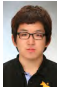
글 | 권창규

(University of Georgia, 성인교육/인적자원개발 박사과정)